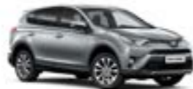
1F7 Сріблястий 2