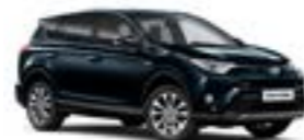
221 Темно-синій 2