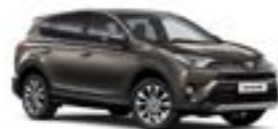
4U5 Темно-коричневий 2

Вся інформація, представлена у цьому матеріалі, є точною та дійсною станом на дату публікації 05.09.2016. Імпортер автомобілів Toyota залишає за собою право вносити зміни до інформації, наведеної в цьому матеріалі, без попереднього повідомлення.