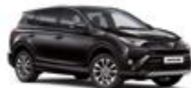
209 Чорний 2