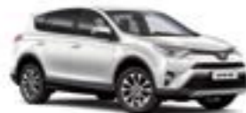
070 Білий перламутр 2