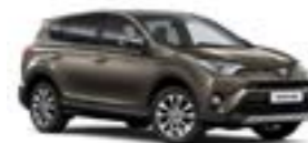
4T3 Бронзовий 2