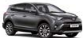
1G3 Сірий 2