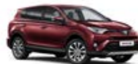
3T0 Темно-червоний 2